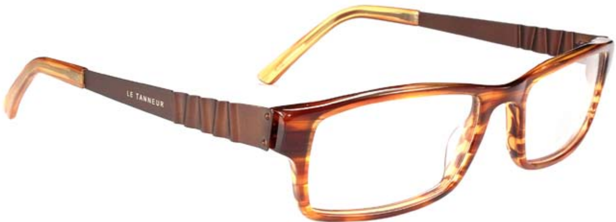
LE200 54□17-138 7B