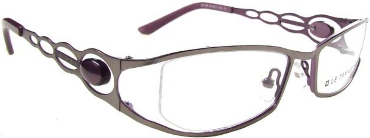
LE159 51□17-135 1A