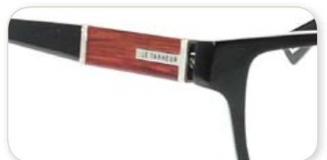
(12B : DEC. 2010)