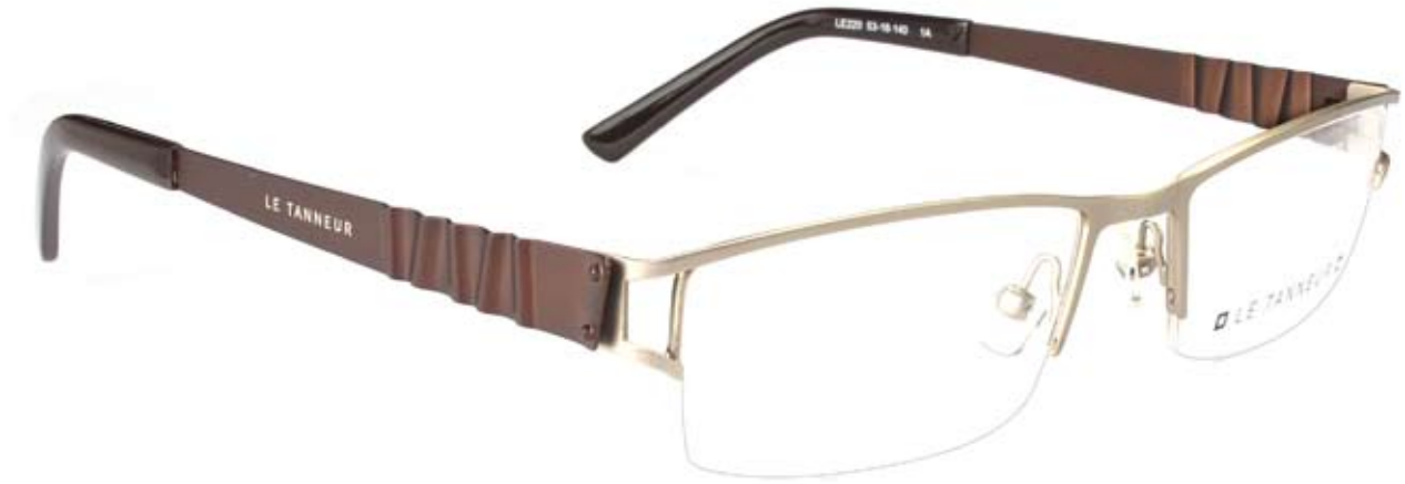
LE220 53□18-140 1A