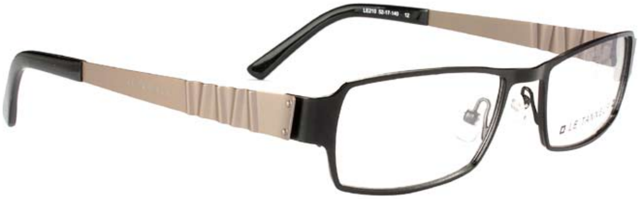
LE210 52□17-140 12