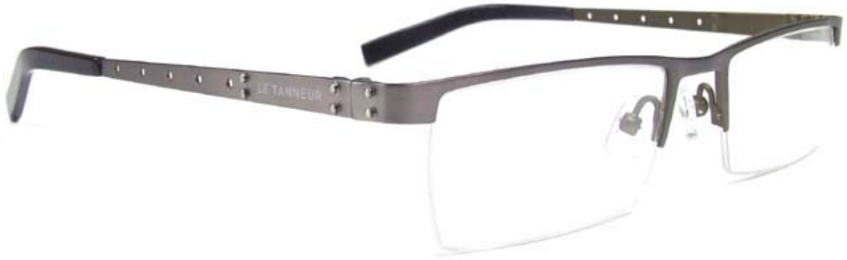
LE528 52□18-140 1A