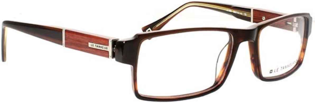
LE289 55□18-145 7B