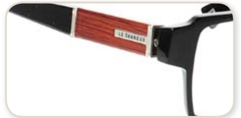
(12B : DEC. 2010)