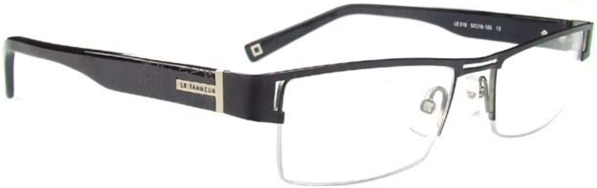
LE219 52□18-135 12