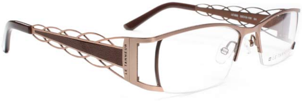
LE820 52□18-138 8A