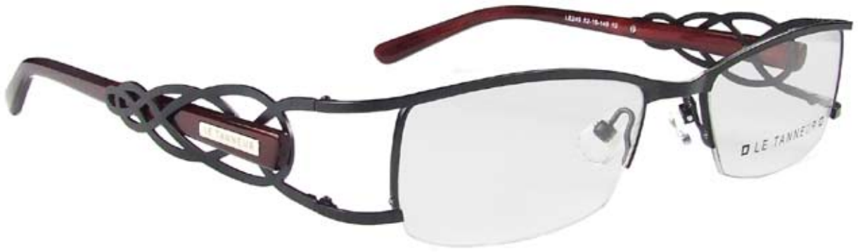
LE249 52□18-140 12