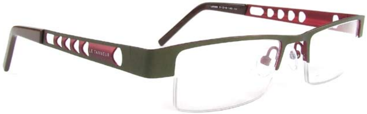
LE588 51□18-140 1A