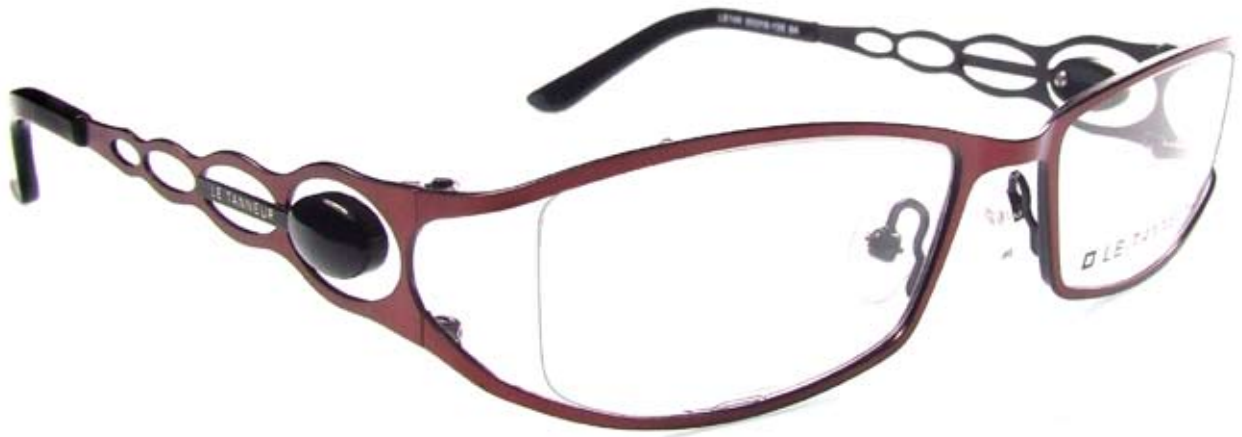
LE149 50□18-135 9A