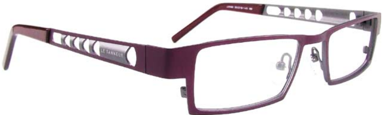
LE598 50□18-140 9B