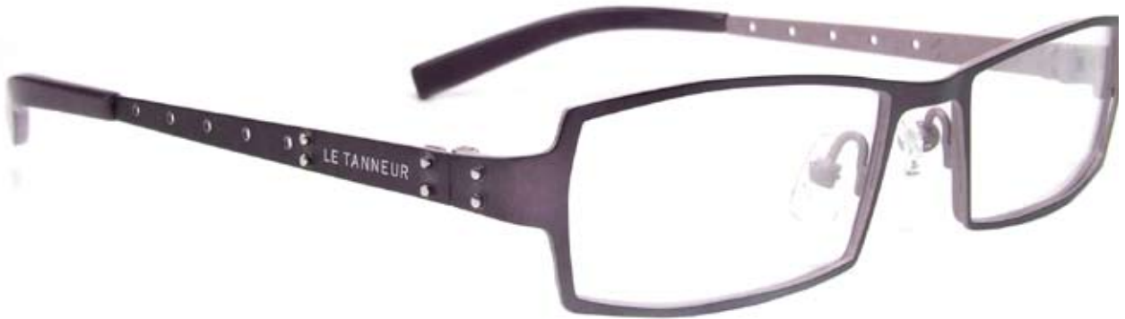
LE538 50□17-140 9B