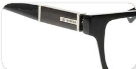
(12 : DEC. 2010)