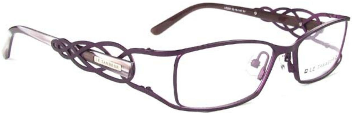
LE259 52□16-140 9V