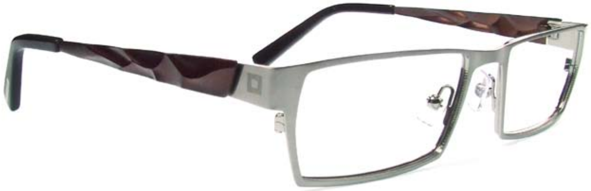
LE109 53□17-140 1A