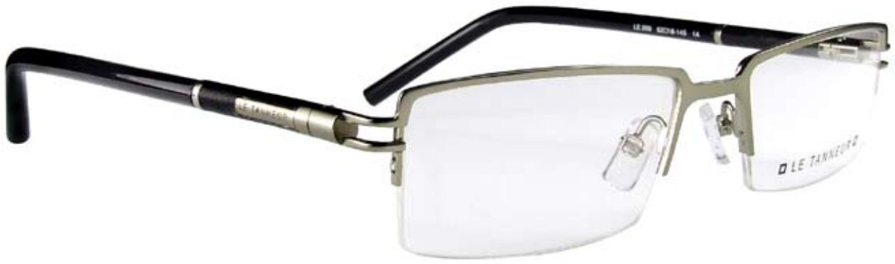
LE269 52□18-145 1A