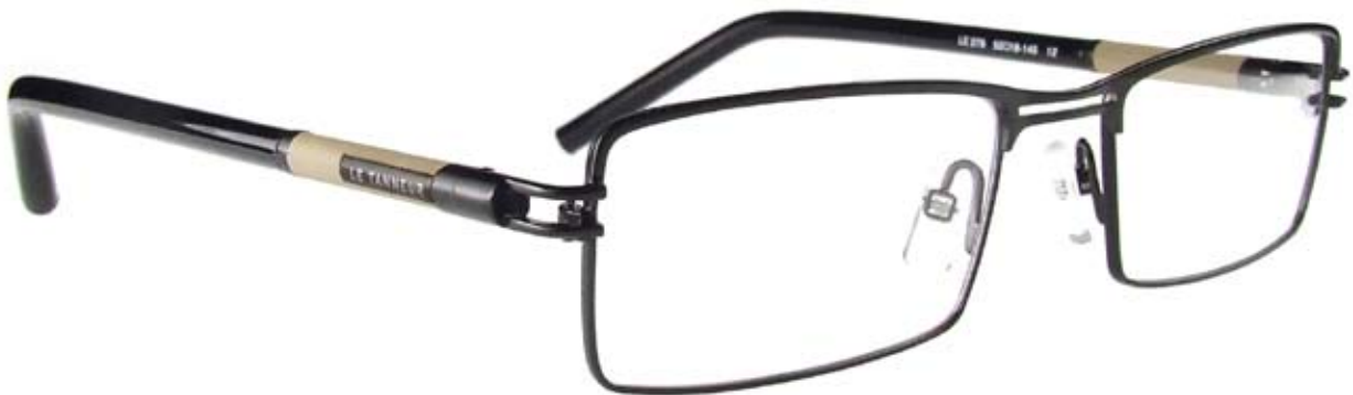
LE279 52□18-145 12